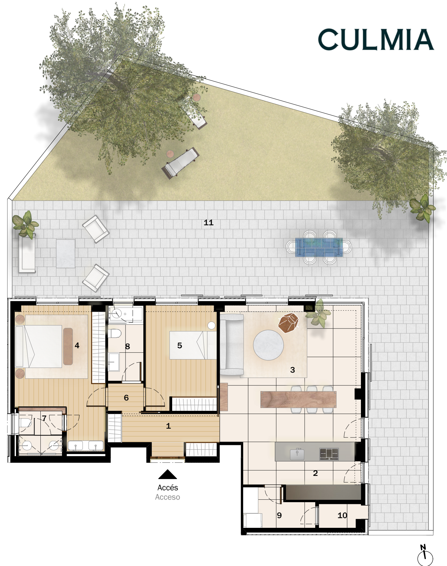
Bloc E2 Bloque E2